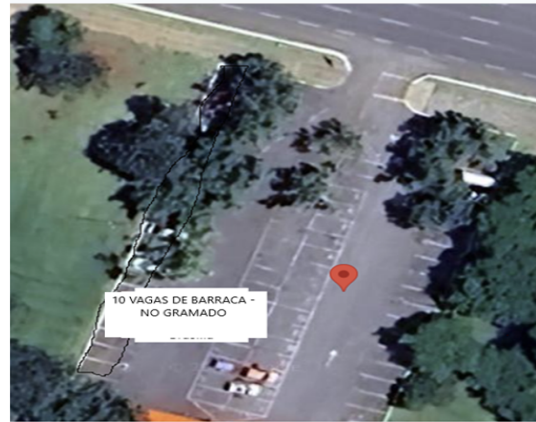
Área 02 Local de licenciamento - gramado ao lado estacionamento do Planetário de Brasília. ( 10 vagas de barraca e 15 vagas de caixeiro)

13.1. Não haverá reserva de vagas no chamamento público para as associações representativas da categoria dos Ambulantes.