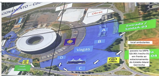
Área 01 Local de Licenciamento - SRPN Qd.901 trecho 01 - Asa Norte/DF. (20 vagas barraca e 15 vagas de caixeiro)

Processo nº 00141-00000749/2026-81. Partes: Administração Regional do Plano Piloto e CONDOMÍNIO SQS 404 BLOCO E, inscrito no CNPJ nº 03.657.145/0001-58, na qualidade de autorizatário. Objeto: formalização da Autorização 1 - Uso Precário de Área Pública (Doc. SEI nº 205359389), que tem por objeto a instalação de 01 (um) contêiner para coleta convencional e 01 (um) contêiner para coleta seletiva em área pública, destinados exclusivamente ao CONDOMÍNIO SQS 404 BLOCO E, conforme orientações técnicas constantes do Doc. SEI nº 195990305. Fundamento Legal: a presente autorização constitui ato administrativo unilateral, discricionário e precário, podendo ser revogada a qualquer tempo, sem direito à indenização, por razões de interesse público, conveniência